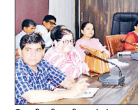
मिवाणी। नीट परीक्षा को लेकर आयोजित बैठक में दिशा निर्देश देते हुए।

आगामी 3 मई को आयोजित होने वाली नीट परीक्षा को सुचारू एवं पारदर्शी ढंग से सम्पन्न कराने को लेकर डीसी साहिल गुप्ता की अध्यक्षता में लघु सचिवालय स्थित डीआरडीए सभागार में समीक्षा बैठक आयोजित की गई। डीसी ने सभी परीक्षा केंद्र अधीक्षकों को निर्देश दिए कि गर्मी के मौसम के चलते जिला में नीट के परीक्षा केंद्रों पर पेयजल व बिजली व्यवस्था सुनिश्चित करें। परीक्षार्थियों को परीक्षा केंद्र में अनुकूल वातावरण मिलना चाहिए। इसके अलावा परीक्षा केंद्रों के अंदर सभी पंखे चालू होना चाहिए और बिजली की वैकल्पिक व्यवस्था के लिए जनरेटर का भी प्रबंध करें। वहीं दूसरी ओर मुख्यमंत्री नायब सिंह सैनी ने भी वीसी