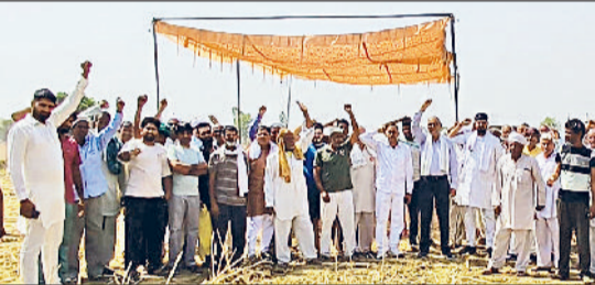
मिवाणी। गांव मानेहरू के खेतों में नारेबाजी करते हुए।