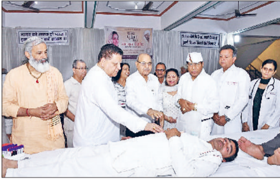
भिवानी। आयोजित रक्तदान शिविर में रक्तदाताओं को बेज लगाते व आयोजित शिविर में उपस्थित रक्तदाता।

जब हृदय में करुणा, प्रेम और एकत्व की दिव्य चेतना जागृत होती है, तब मानव अपने सीमित स्वार्थों से ऊपर उठकर सम्पूर्ण सृष्टि के कल्याण का सशक्त माध्यम बन जाता है। परोपकार, करुणा और परमार्थ जैसे अलौकिक मूल्यों से प्रकाशमान यह पावन अवसर उस दिव्य अनुभूति का प्रतीक बना, जहाँ "मानव को मानव हो प्यारा, एक-दुजे का बने सहाय" का संदेश केवल शब्दों तक सीमित न रहकर हृदयों में जीवंत हुआ। 'मानव एकता दिवस' 24 अप्रैल को, बाबा गुरुबचन सिंह की दिव्य स्मृति में, सतगुरु माता सुदीक्षा महाराज एवं निरंकारी राजपिता जी के सान्निध्य में दिल्ली के ग्राउंड नं. 8 में आयोजित हुआ। इसके साथ ही समूचे देश की हजारों सत्संग केंद्रों पर श्रद्धा और समर्पण भाव से सफलतापूर्वक सम्पन्न हुआ। यह