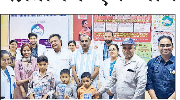
भिवानी। चौधरी बंसीलाल नागरिक अस्पताल में विश्व हीमोफिलिया दिवस पर कार्यक्रम में अतिथियों के साथ बच्चे।