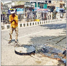
पिछले कई हफ्तों से सीवर का गंदा पानी दुकानों के आगे भरा रहता है। तेज बदबू के कारण ग्राहक दुकानों पर आना बंद कर चुके हैं। मजबूरी में दुकानदार देर से दुकान खोलते हैं और शाम होते ही शटर गिरा देते हैं। पूरे दिन मखियायें भिन्नभिन्नती रहती हैं। विभाग की लापरवाही उजागर लोगों का आरोप है कि शिकायत के

■ लोग बोले-ऐसे विकास की कल्पना नहीं की थी