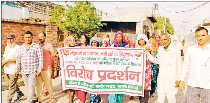
को।प्रदर्शनकारी महिलाओं ने कांग्रेस पार्टी, समाजवादी पार्टी, तुणमूल कांग्रेस और द्रविड़ मुनेत्र कश्मम जैसे दलों पर निशाना साधते हुए आरोप लगाया कि ये पार्टियां नारी शक्ति बंदन अधिनियम के रास्ते में बाधाएं खड़ी कर रही हैं। उनका कहना था कि देश अब बेटियों के

गांव की गलियों में निकाले गए इस प्रदर्शन में बड़ी संख्या में महिलाओं ने भाग लिया और बैनर-पोस्टर के साथ विपक्ष की कथित महिला विरोधी सोच के खिलाफ नारेबाजी