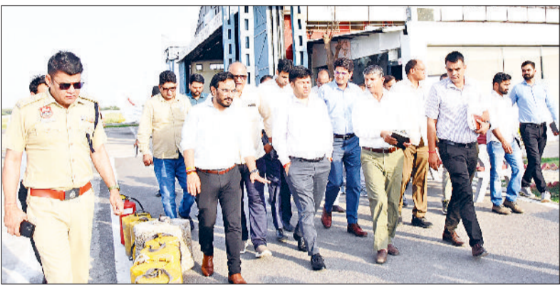
हरिभूमि न्यूज ►► मिवानी

भारत के सर्वोच्च न्यायालय के मुख्य न्यायाधीश न्यायमूर्ति सूर्यकांत के 25 अप्रैल को भिवानी आगमन को लेकर जिला प्रशासन पूरी तरह से अलर्ट मोड में नजर आ रहा है। उनके दौरे को लेकर सुरक्षा व्यवस्था से लेकर बुनियादी ढांचे तक हर स्तर पर तैयारियों को अंतिम रूप दिया जा रहा है।